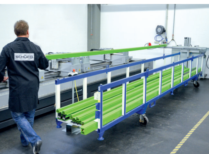
am Bearbeitungszentrum at the processing centre