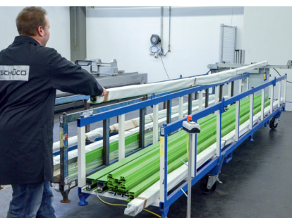
zum Kommissionieren for picking profiles