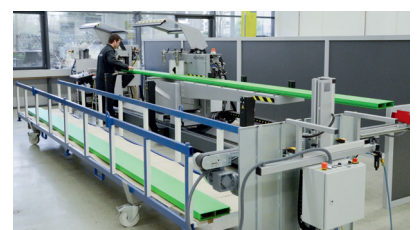
Heben, Transportieren, Ablegen Lift, Transport, Store