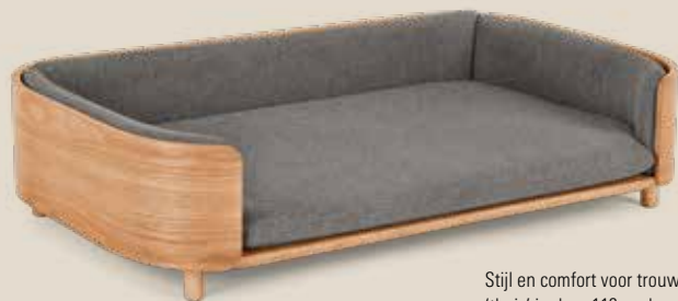
Stijl en comfort voor trouwe viervoeters. Zelfs de grootste honden voelen zich 'thuis' in deze 113 cm brede hondenmand van Kyali .