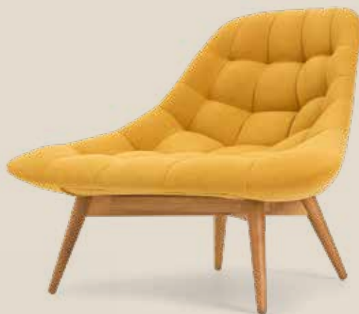
De comfortabele loungestoel van Kolton zou zo maar eens kunnen uitgroeien tot je favoriete plek in huis.