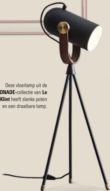
Deze vloerlamp uit de CARRONADE -collectie van Le Klint heeft slanke poten en een draaibare lamp.