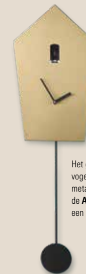
Het glanzende koperen vogelhuisje en de zwarte metalen wijzers maken de Aza koekeeklok tot een tijdloze klassieker.