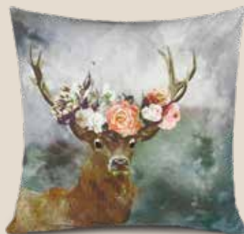
Een bloemenkroon: geef je bank kleur met deze kussenhoes van IMPRESSIONEN Living .