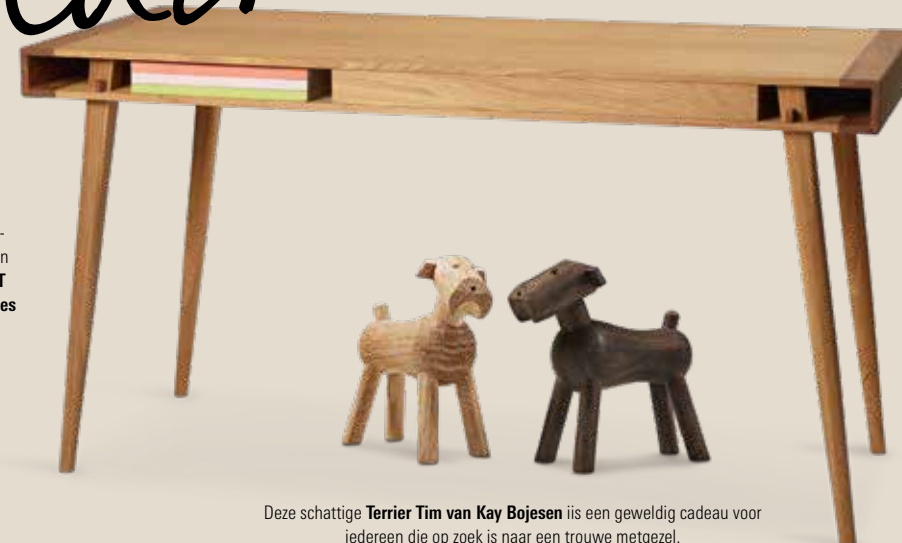
Deze schattige Terrier Tim van Kay Bojesen is een geweldig cadeau voor iedereen die op zoek is naar een trouwe metgezel.