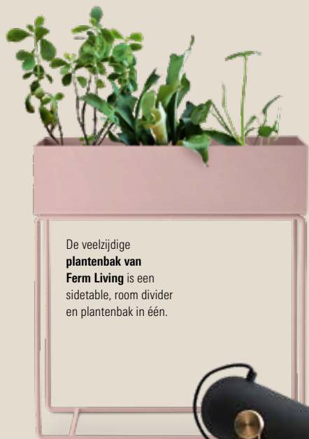
De veelzijdige plantenkast van Ferm Living is een sidetable, room divider en plantenkast in één.