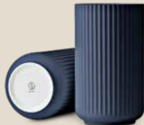
Deze decoratieve vazen van Lyngby Porcelæn zijn – zowel met als zonder bloemen – een aanwinst voor elke huiskamer.