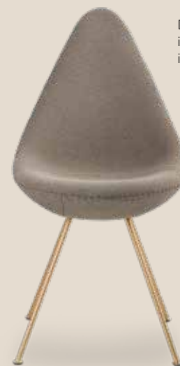
De Drop™ van Fritz Hansen is een sierlijke stoel die in elk interieur past.