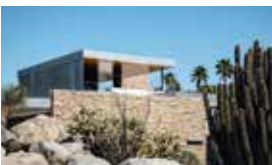
"Kaufmann Desert House"